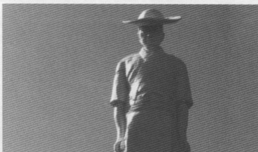
再建された観海流流祖「宮発太郎」像

現在、観海流は津における無形文化財としての認知度が減っており、会員数の確保が大変になっている。そして現在の泳ぎ手が五十代以上が多く、行政の協力も求め流派存続のために日本泳法委員会としても普及と保存を助けたいと考えている。